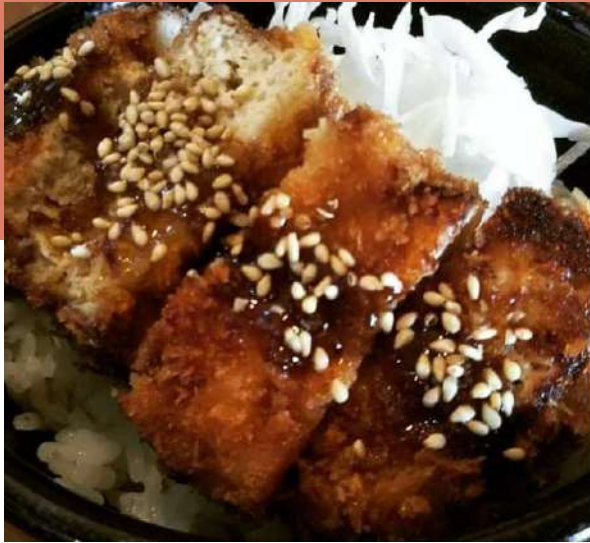
豆腐ソースカツ丼 とうふ工房 亜蔵さん