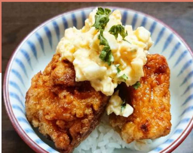
チキン南蛮風豆腐丼