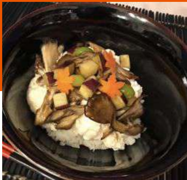
豆腐と山芋の秋の吹き寄せど んぶり