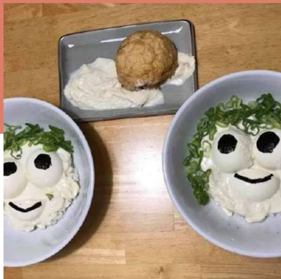
かおりちゃん達のお月見丼