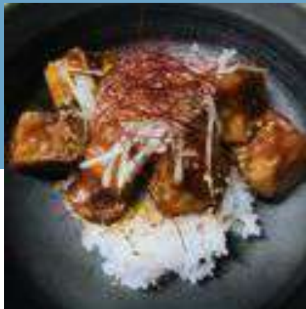
ヤムニョム豆腐丼