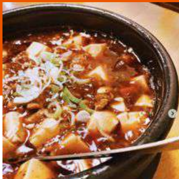
麻婆豆腐丼 きぬりんさん