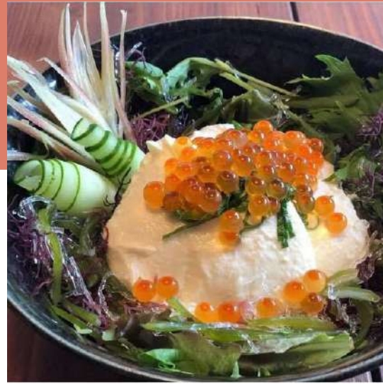
贅沢ご褒美飯豆腐丼 親父のガンコとうふさん