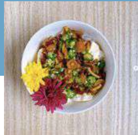
菊とおぼろ豆腐丼